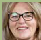
MK Mette Krabbe