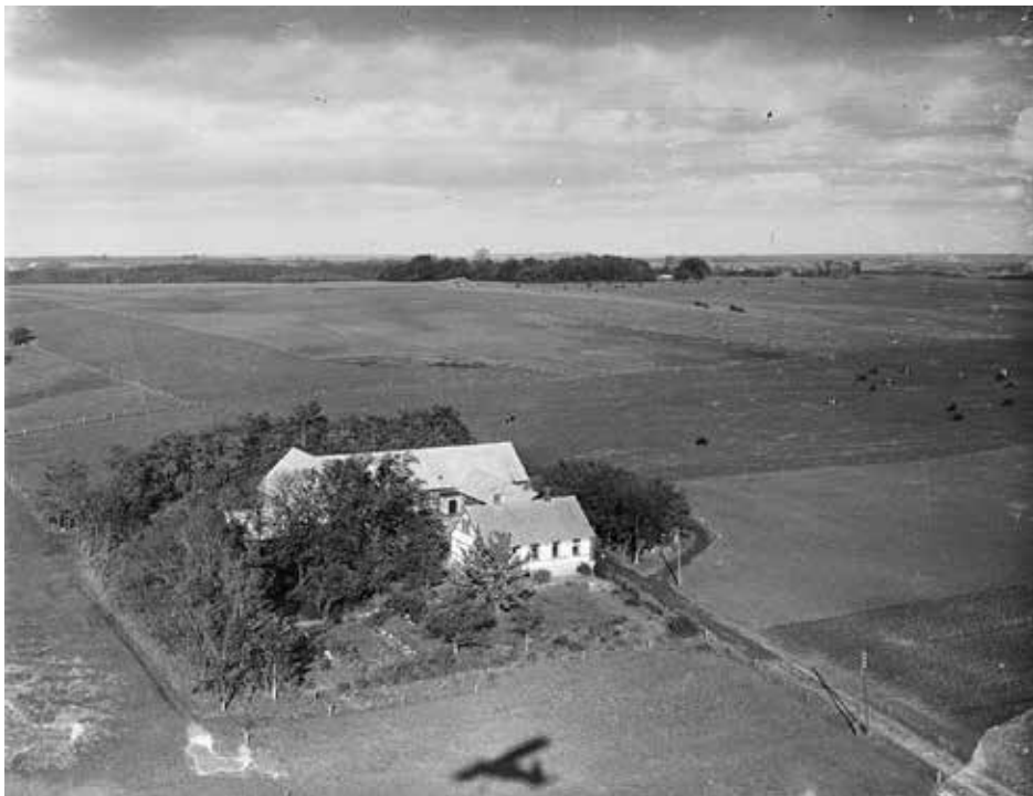
Her ses Vibegård i 1950.