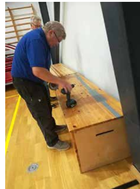
Reparation af aktivitetskasse

Borgerforeningen vil gerne forsøge at etablere et møde mere med kommunen, hvis der er mange nok, der har brug for yderligere belysning af fordelene og ulemper ved Selling som centerby.