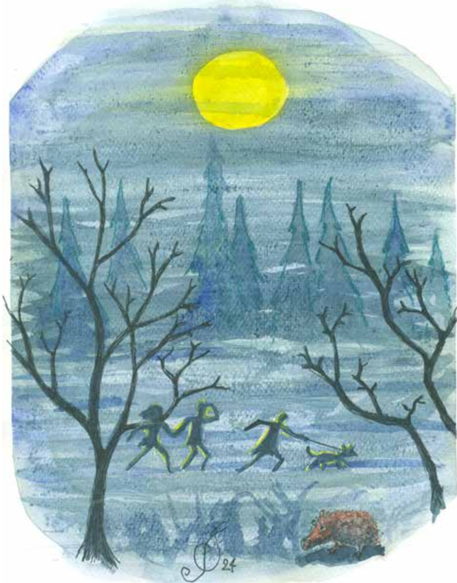
Tegning: Per Tjørnild