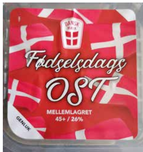
Også Fødselsdagsosten er fra et lokalt supermarked.