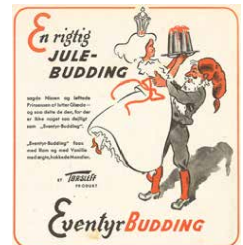
Heldigvis sørgede man da før i tiden, for at julen blev reddet. Annoncen er set på Bindeballe Købmandsgård.