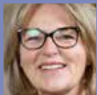
MK Mette Krabbe