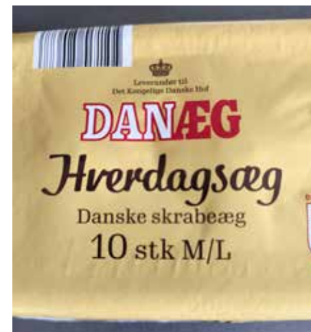
Hverdagsæg sælger de hver dag i supermarkederne.