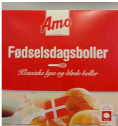
Her et billede fra et af de lokale supermarkeder.

Værre er det da, hvis man kunne tænke sig et blødkogt æg en helligdag eller en weekend, hvad så?