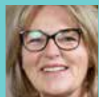
MK Mette Krabbe