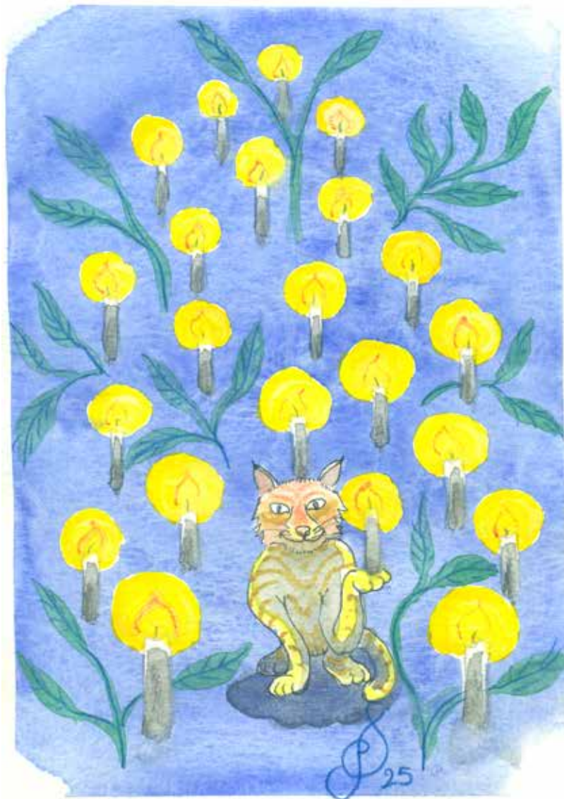
Tegning: Per Tjørnild