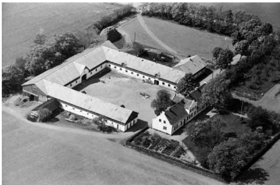
Det Kgl. Biblioteks billede af Højstrup i 1947.